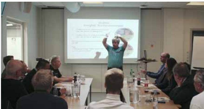
Lederudvikling på Forum 2016 med fokus på personlig kommunikation for mere end 10 klubber

Samarbejdet på tværs af klubber i Masterklub og klubber uden for programmet, udvides i årene frem til og med 2018. Sundheden i klubberne skal styrkes, så ungdomsarbejdet bliver nemmere fremover.